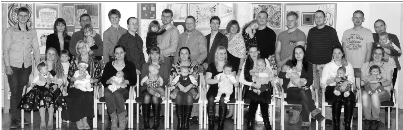
28. jaanuaril olid vallavanema pidulikult vastuvõtul 2016.aastal sündinud beebid koos peredega. Eelmisel aastal sündis meie vallas 15 last, 9 poissi ja 6 tüdrukut. Õnne pisikestele ja nende peredele!